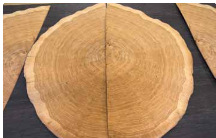
Fornir z dębu czarnego bagiennego został pozyskany z kłód drewna dębowego w wieku od około 2000 lat do ponad 3000 lat.